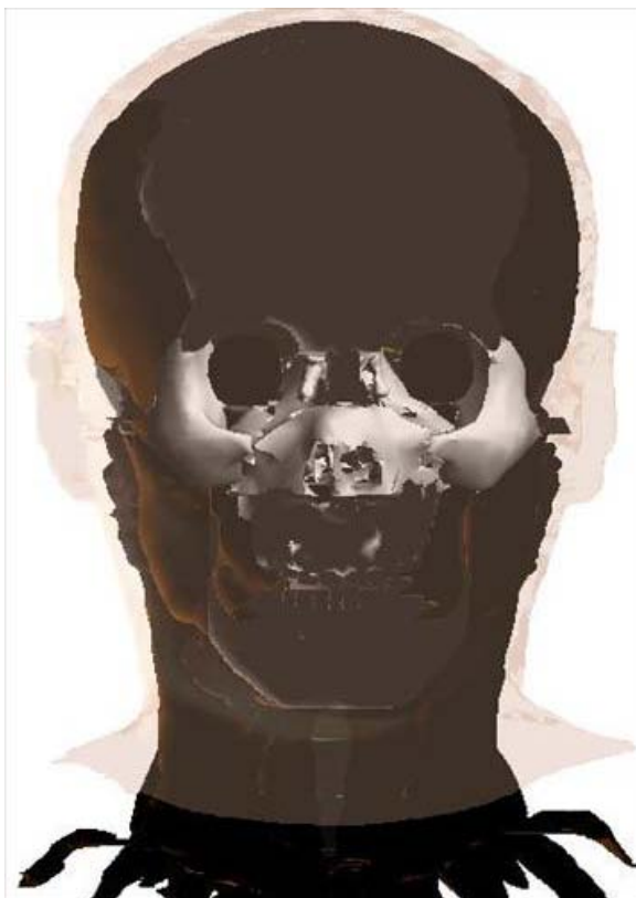
남성 머리부분의 3차원 입체영상 사진. PDF 파일에서는 머리 부분을 확대하거나 돌려보면서 자유자재로 작업이 가능하다.